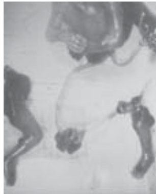
Abtreibung durch Kürettage in der 12. Schwangerschaftswoche

Mit einem scharfen, gebogenen Messer wird der Körper des Kindes in kleine Stücke geschnitten und die Plazenta von den Innenwänden der Gebärmutter geschabt. Auch hier kann man mühelos die einzelnen Körperteile erkennen. ➤➤