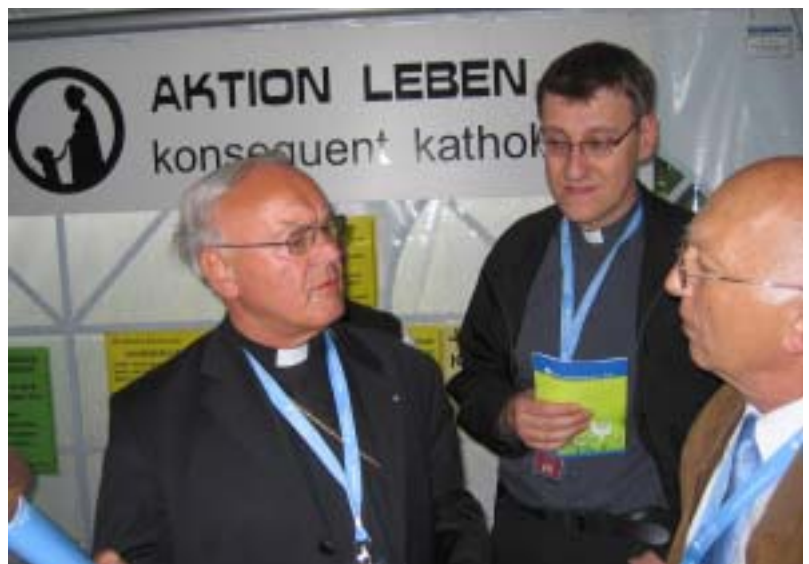
Bischof Algermissen (Fulda) im Gespräch mit Walter Ramm in unserem Infostand.

Daß wir dann doch bleiben konnten, verdanken wir ganz sicher dem beherzten öffentlichen Eintreten von Weihbischof Laun (Salzburg), der demonstrativ selbst diese Modelle verteilte. Auch Bischof Algermissen (Fulda), der zu einem längeren Gespräch an unserem Infostand verweilte, forderte uns auf: „Haltet durch!“. Wir sind Bischof Algermissen dank-