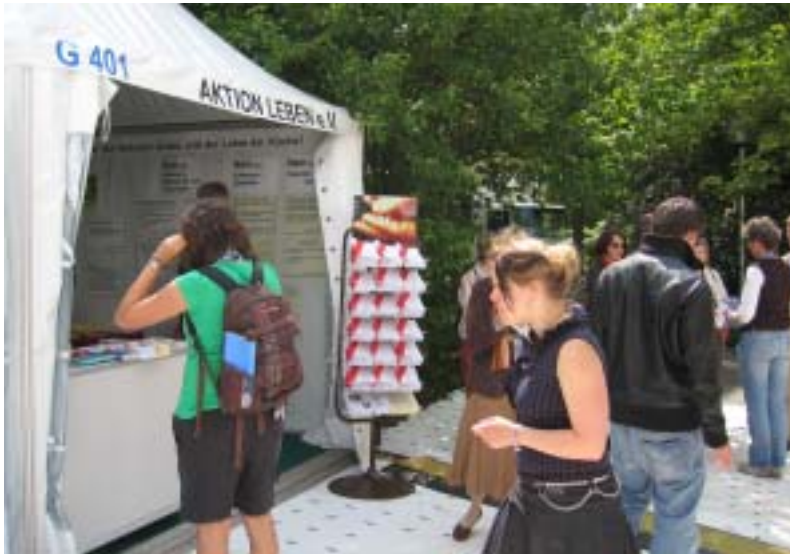
Unser Infostand, ganz am Rand des Katholikentags. Trotzdem kamen viele Menschen zum Gespräch und um unsere Infoschriften mitzunehmen.

Woche), die wir an unserem Stand zeigten und verteilten. Sie seien „anstößig“! Weil wir eine Entfernung dieser Modelle, die die Katholikentagsleitung diktatorisch von uns forderte, als Verrat an den ungeborenen Kindern und unserer Arbeit betrachteten und die Modelle nicht, wie es eine andere Lebensrechtsgruppe tat, verschwinden ließen, sollten wir ausgeschlossen werden.