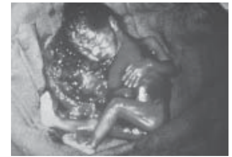
Abtreibungstötung durch Salzverätzung im 5. Schwangerschaftsmonat